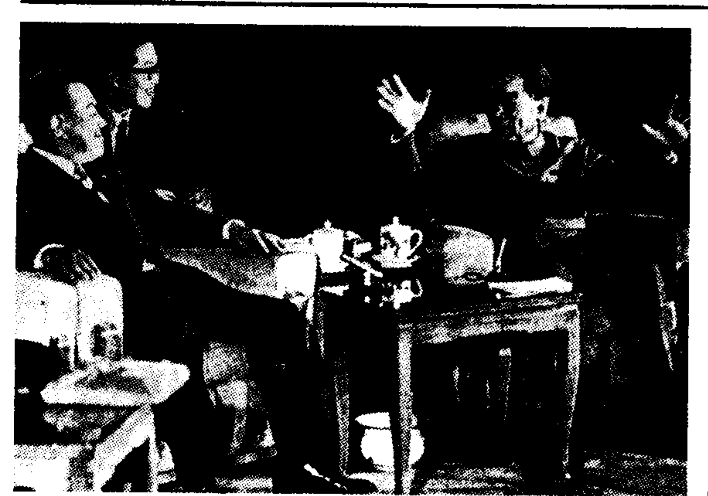
Στιγμιότυπο από τη χθεσινή συνάντηση στο Πεκίνο του πρωθυπουργού της Λαϊκής Κίνας Τσού Έν Λαί (δεξιά) και του 'Αμερικανού πρωθυπουργού Κωνσταντίνου Κηρύ (αριστερά) για την πρώτη μεταπολεμική συνάντηση ηγέτων των δύο κρατών.