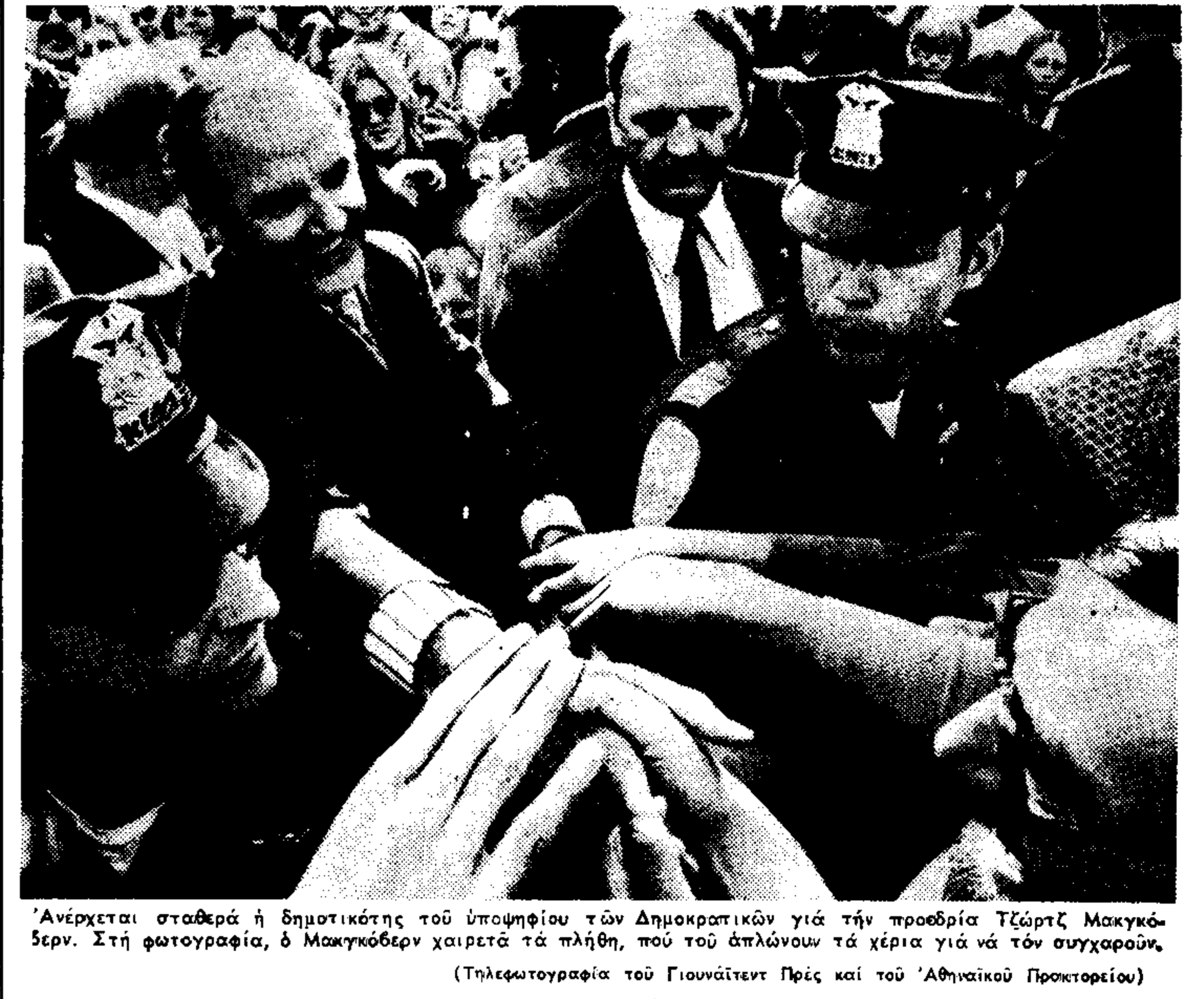
Ανέρχεται σταθερά η δημοτικότητα του υποψηφίου των Δημοκρατικών για την προεδρία Τζόρτζ Μαγκκόβερν. Στη φωτογραφία, ο Μαγκκόβερν χειρατά τή πλάτη, που τόν απλώνουν τά χέρια γιά να τόν συγχωρούν...