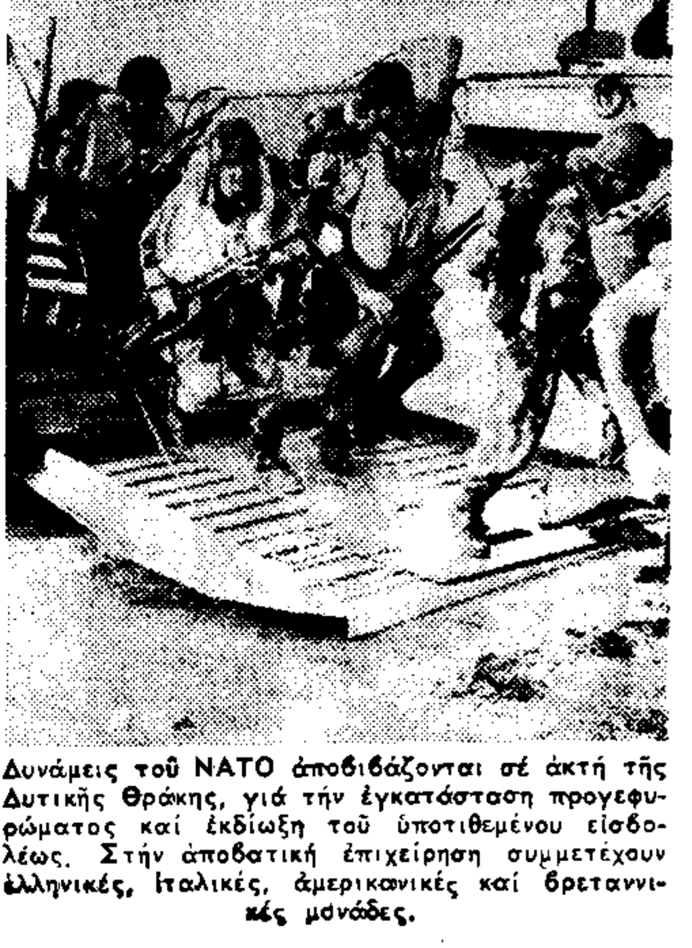
Ανάμεσα με NATO αποδίδονται σε ακτή της Δυτικής Θράκης, για την εγκατάσταση προγεφυρώσεως και έκδοσης του υποθαλάσσιου ελασίου...